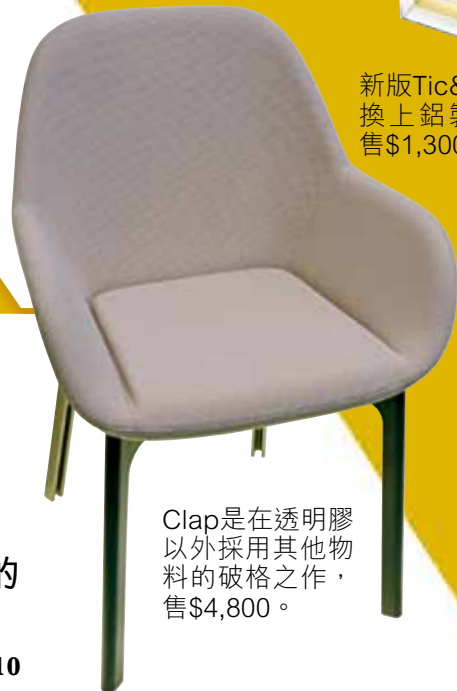
Clap是在透明膠以外採用其他物料的破格之作，售$4,800。