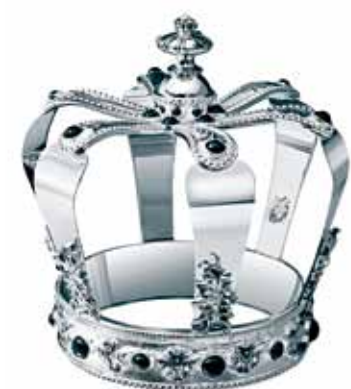
《Crowns Silver Kingdom》高24cm，全球只限量二十件，售$153,450。

有「王室御用銀器供應商」之稱的法國Christofle(昆庭)，今年跟英國設計師Martyn Lawrence Bullard合作，推出名為《Crowns Silver Kingdom》銀器創新擺設，質材為純銀鑲上黑瑪瑙，全球限量發行二十件，其中一件(編號為No.2)正於香港中環太子大廈Christofle專門店內展出，展期至今年底。查詢/ Christofle(太子大廈)/2869 7311